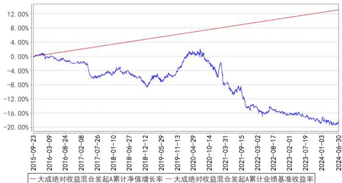
大成绝对收益混合发起A累计净值增长率与同期业绩比较基准收益率的历史走势对比图

(二) 自基金合同生效以来基金份额累计净值增长率变动及其与同期业绩比较基准收益率变动的比较