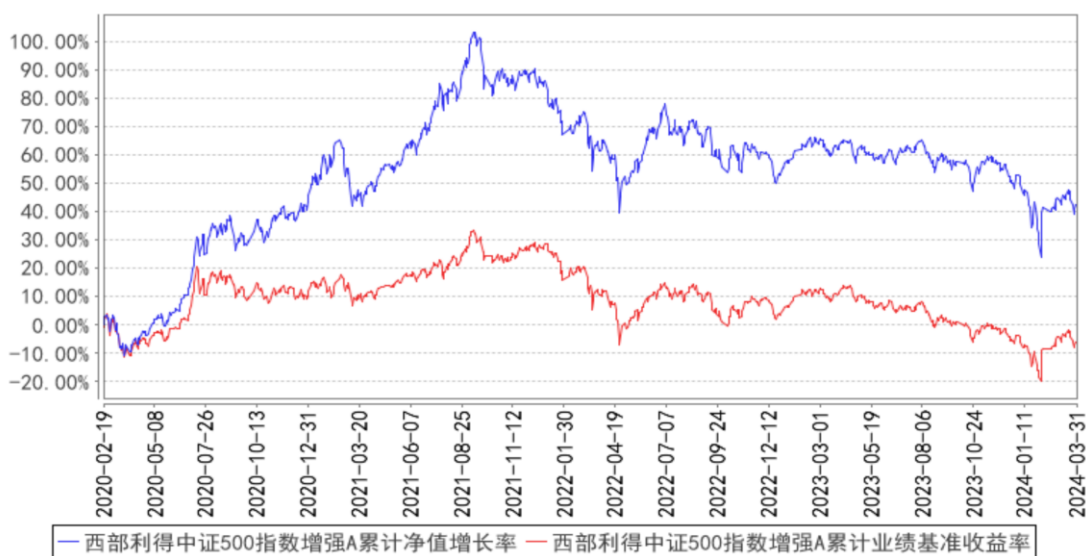
西部利得中证500指数增强A累计净值增长率与同期业绩比较基准收益率的历史走势对比图

2) 西部利得中证500指数增强型证券投资基金(LOF)C(2020年04月13日至2024年03月31日)