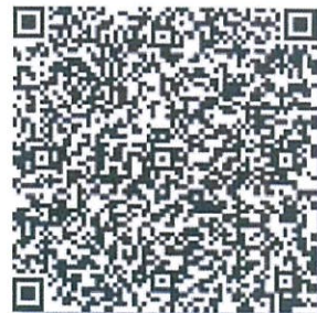
赵金的年检二维码.png