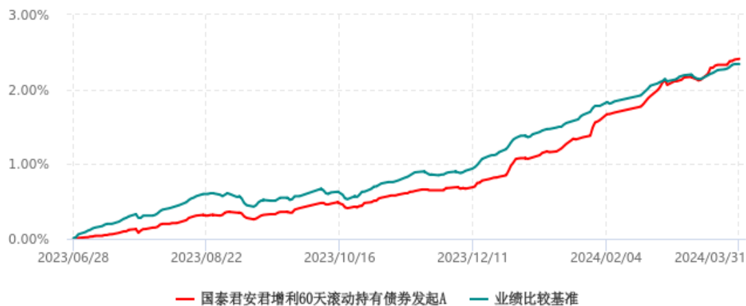
国泰君安君增利60天滚动持有债券发起A累计净值增长率与业绩比较基准收益率历史 走势对比图 (2023年06月28日-2024年03月31日)

注：1、本基金于 2023 年 06 月 28 日成立，自合同生效日起至本报告期末不足一年。