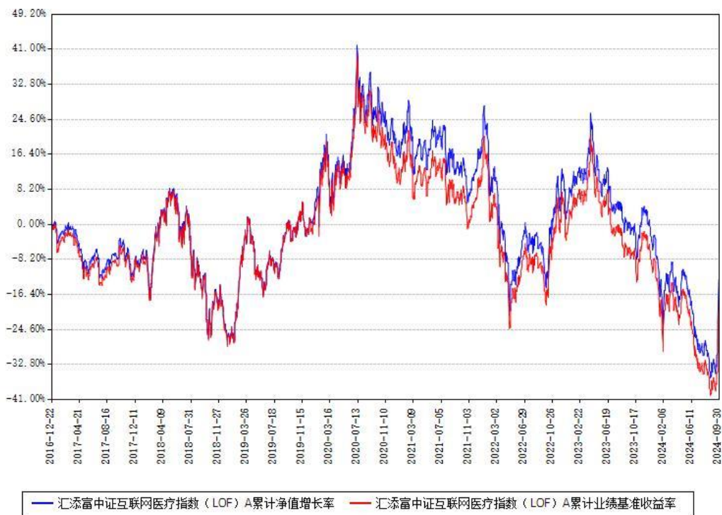
汇添富中证互联网医疗指数（LOF）A累计净值增长率与同期业绩基准收益率对比图

（二）自基金合同生效以来基金累计净值增长率变动及其与同期业绩比较基准收益率变动的比较图