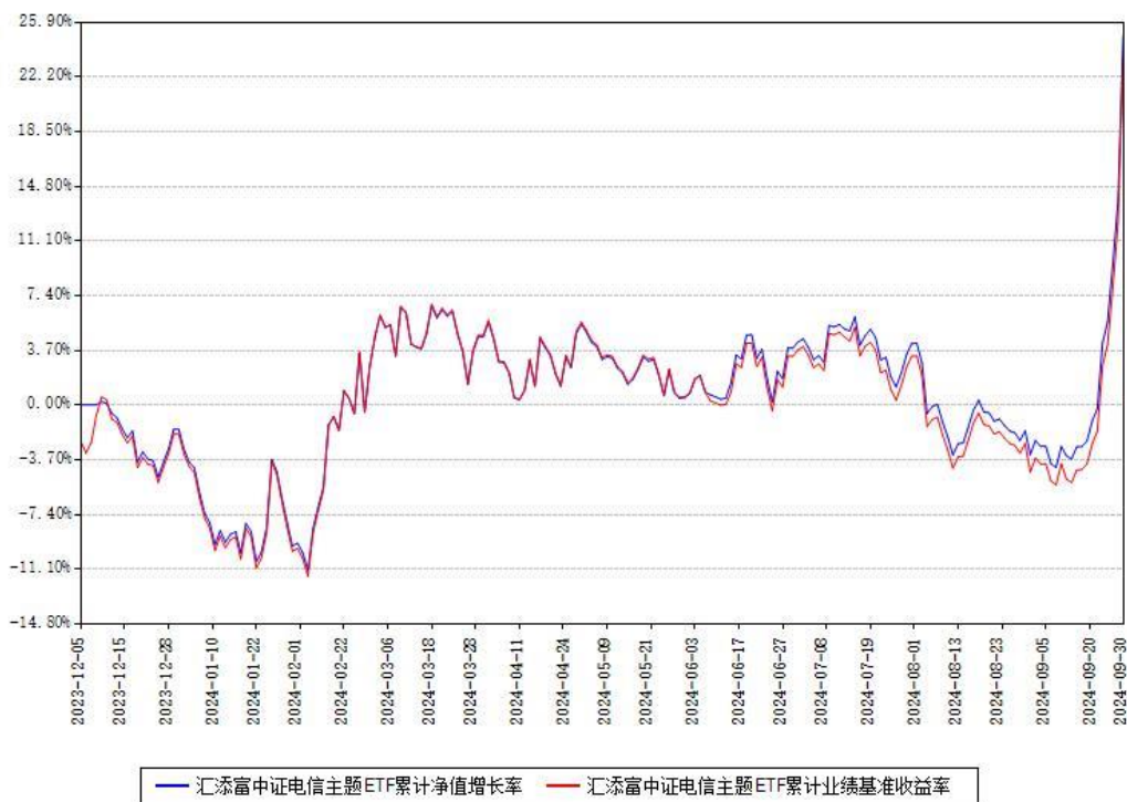
汇添富中证电信主题ETF累计净值增长率与同期业绩基准收益率对比图