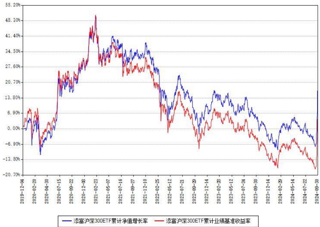
添富沪深300ETF累计净值增长率与同期业绩基准收益率对比图