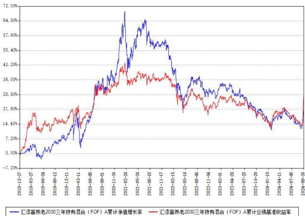
汇添富养老2030三年持有混合 (FOF) A 累计净值增长率与同期业绩基准收益率对比图

(二)自基金合同生效以来基金累计净值增长率变动及其与同期业绩比较基准收益率变动的比较图