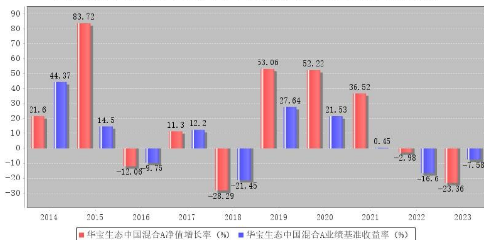
华宝生态中国混合A每年净值增长率与同期业绩比较基准收益率的对比图