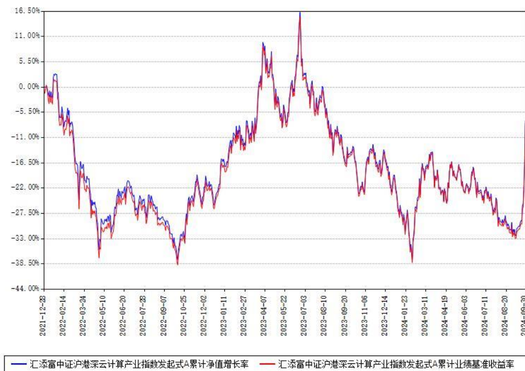
汇添富中证沪港深云计算产业指数发起式A累计净值增长率与同期业绩基准收益率对比图

(二)自基金合同生效以来基金累计净值增长率变动及其与同期业绩比较基准收益率变动的比较图