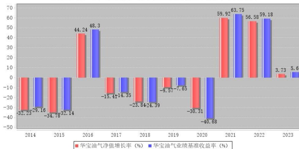
华宝油气每年净值增长率与同期业绩比较基准收益率的对比图