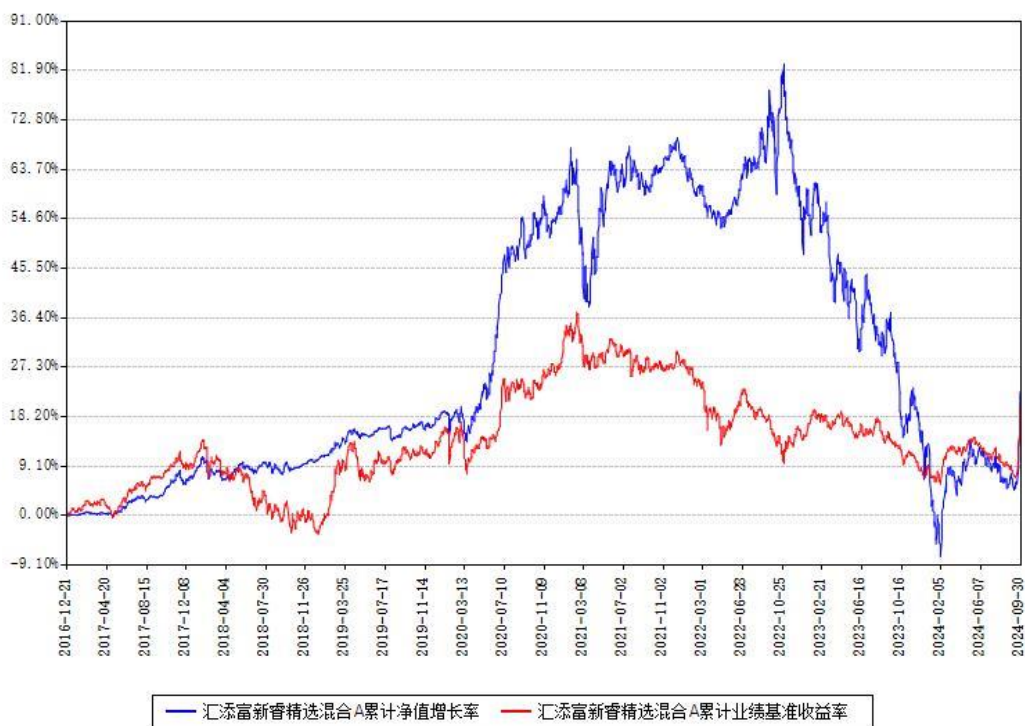
汇添富新睿精选混合A累计净值增长率与同期业绩基准收益率对比图

(二)自基金合同生效以来基金累计净值增长率变动及其与同期业绩比较基准收益率变动的比较图