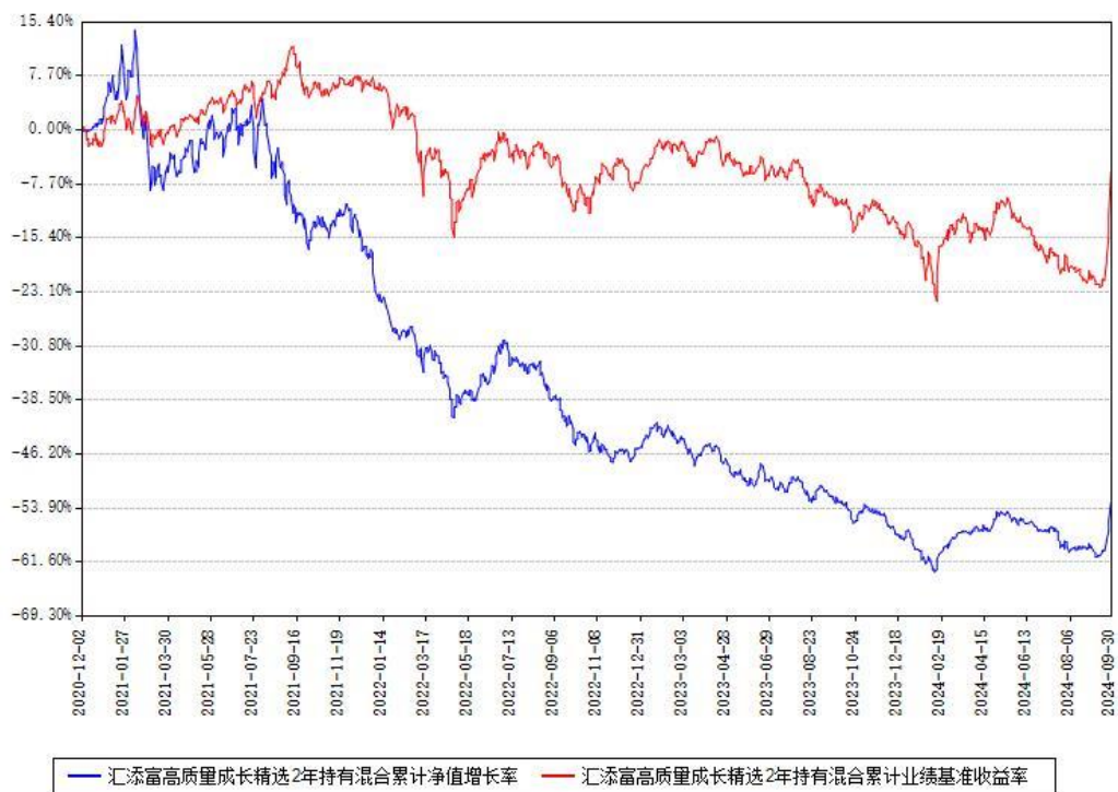
汇添富高质量成长精选2年持有混合累计净值增长率与同期业绩基准收益率对比图