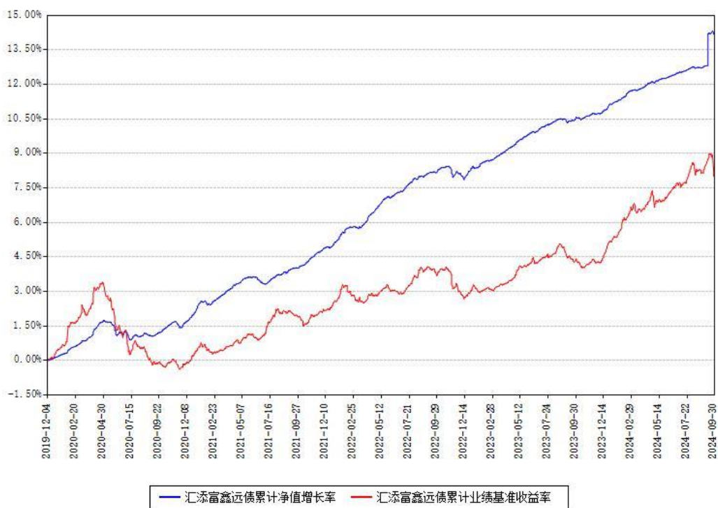
汇添富鑫远债累计净值增长率与同期业绩基准收益率对比图