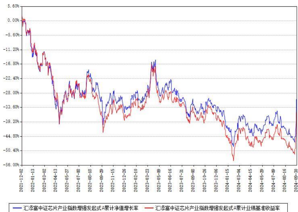
汇添富中证芯片产业指数增强发起式A累计净值增长率与同期业绩基准收益率对比图