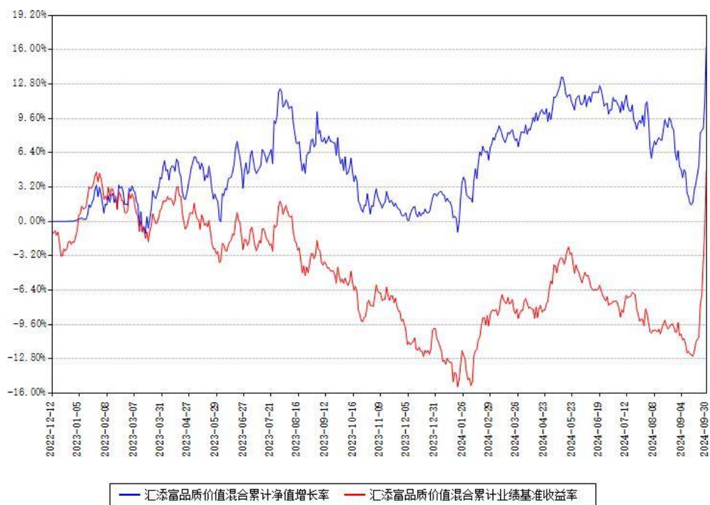
汇添富品质价值混合累计净值增长率与同期业绩基准收益率对比图