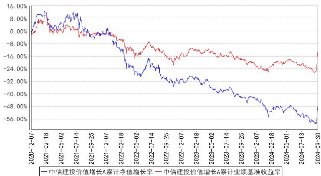
中信建投价值增长A累计净值增长率与同期业绩比较基准收益率的历史走势对比图