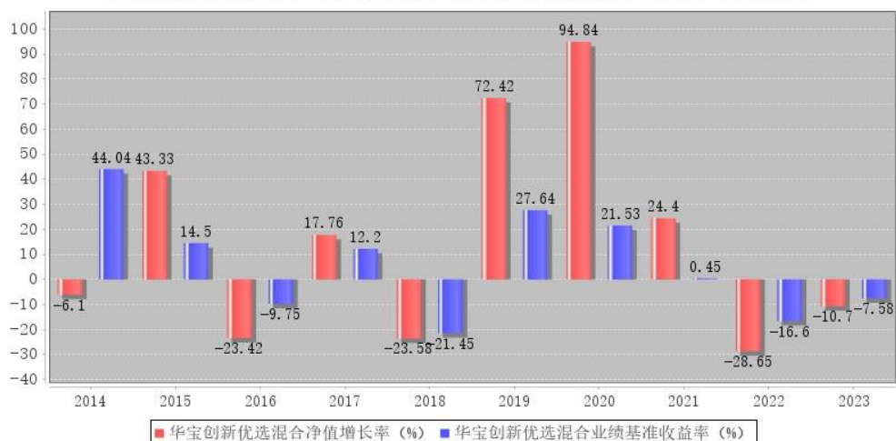
华宝创新优选混合每年净值增长率与同期业绩比较基准收益率的对比图