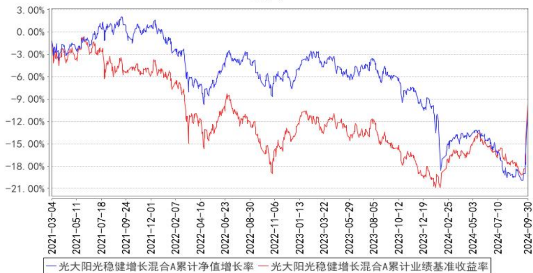
光大阳光稳健增长混合A累计净值增长率与同期业绩比较基准收益率的历史走势对比图