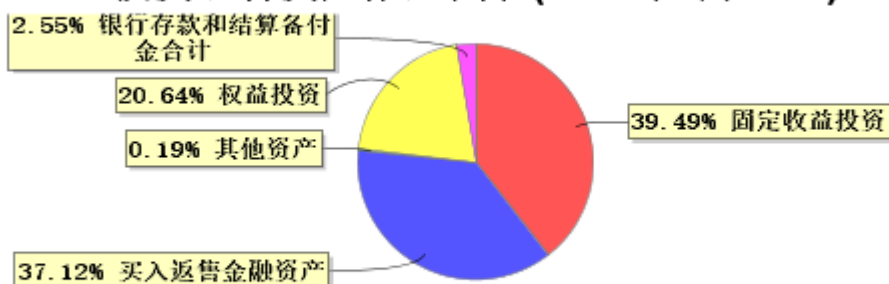
投资组合资产配置图表(2024年6月30日)