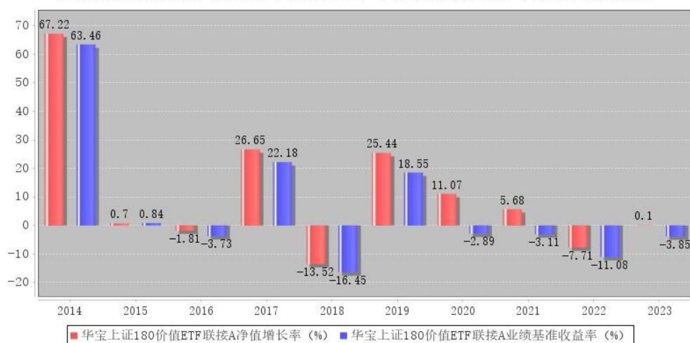
华宝上证180价值ETF联接A每年净值增长率与同期业绩比较基准收益率的对比图