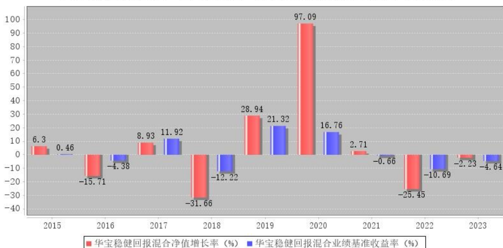
华宝稳健回报混合每年净值增长率与同期业绩比较基准收益率的对比图