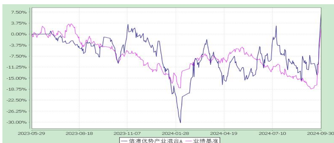
信澳优势产业混合 C 累计净值增长率与业绩比较基准收益率的历史走势对比图