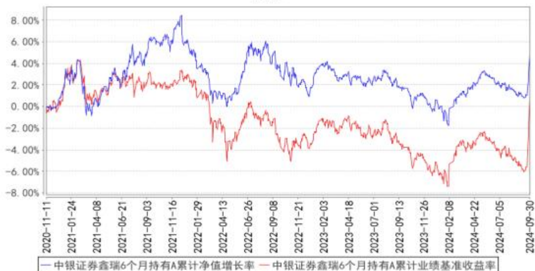
中银证券鑫瑞6个月持有A累计净值增长率与同期业绩比较基准收益率的历史走势对比图