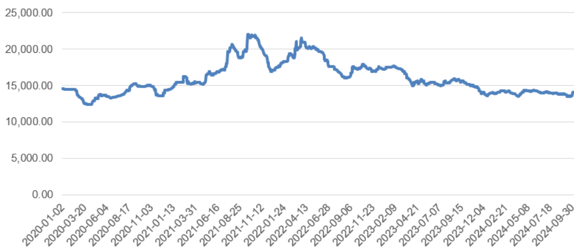
现货价:不锈钢, 元/吨