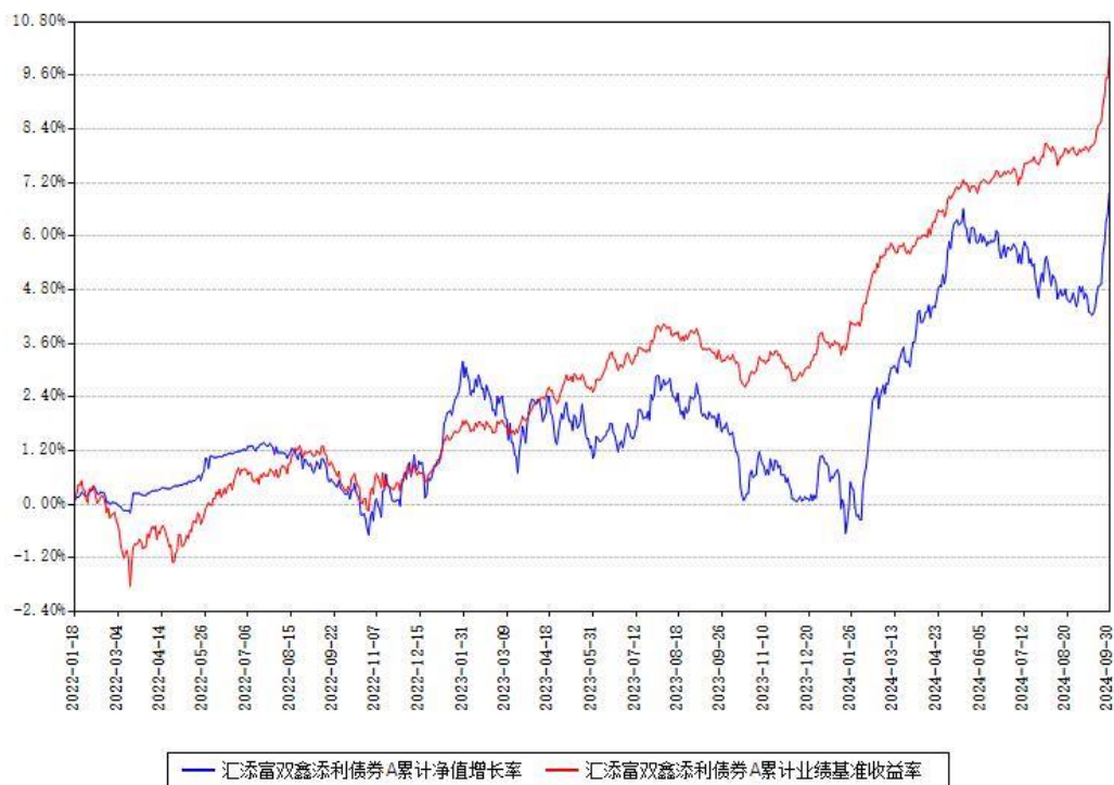
汇添富双鑫添利债券A累计净值增长率与同期业绩基准收益率对比图