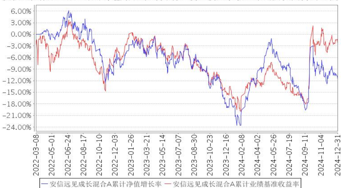
安信远见成长混合A累计净值增长率与同期业绩比较基准收益率的历史走势对比图