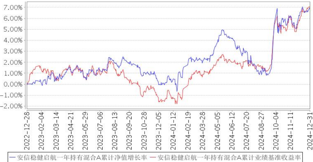
安信稳健启航一年持有混合A累计净值增长率与同期业绩比较基准收益率的历史走势对比图