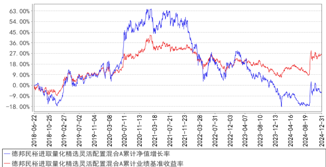
德邦民裕进取量化精选灵活配置混合A累计净值增长率与同期业绩比较基准收益率的历史走势对比图