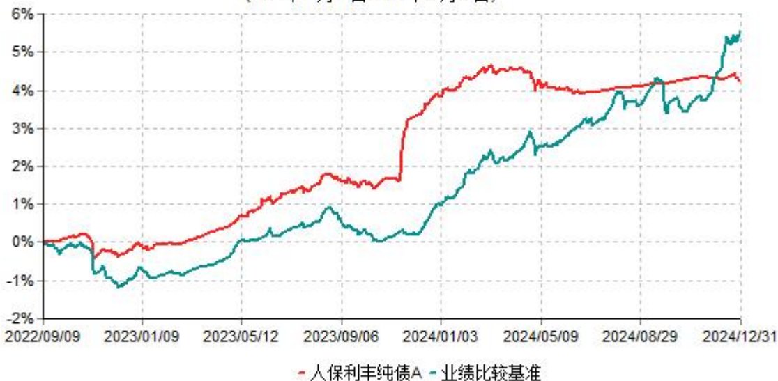
人保利丰纯债A累计净值增长率与业绩比较基准收益率历史走势对比图 (2022年09月09日-2024年12月31日)