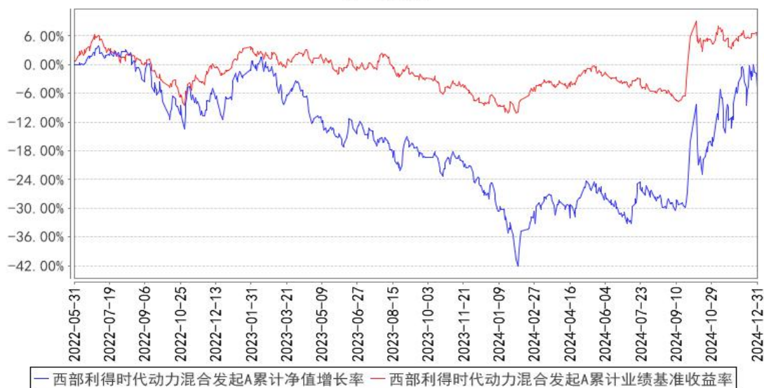
西部利得时代动力混合发起A累计净值增长率与同期业绩比较基准收益率的历史走势对比图