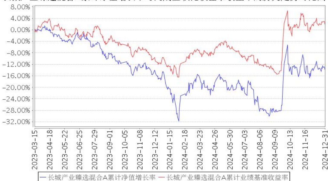
长城产业臻选混合A累计净值增长率与同期业绩比较基准收益率的历史走势对比图