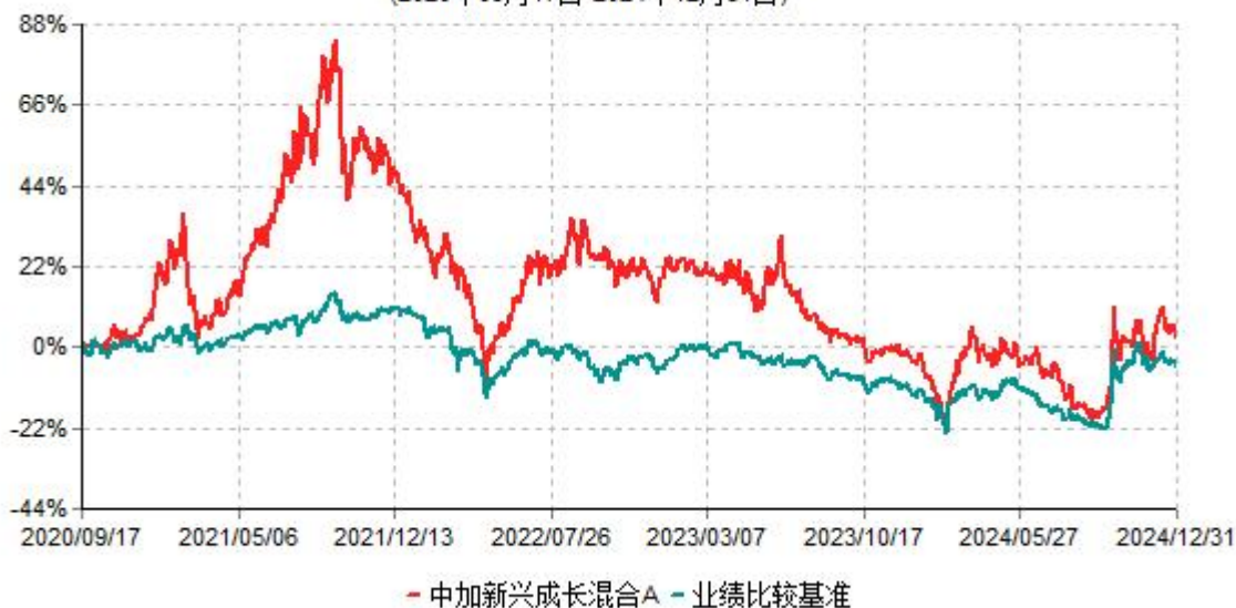
中加新兴成长混合A累计净值增长率与业绩比较基准收益率历史走势对比图 (2020年09月17日-2024年12月31日)