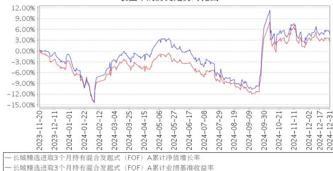
长城精选进取3个月持有混合发起式（FOF）A累计净值增长率与同期业绩比较基准收益率的历史走势对比图