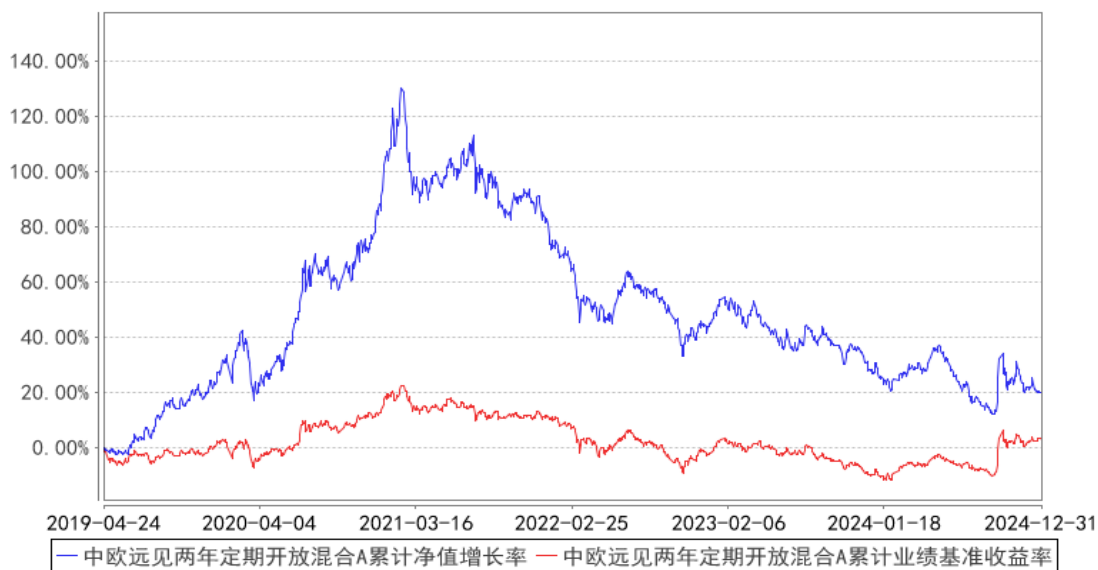
中欧远见两年定期开放混合A累计净值增长率与同期业绩比较基准收益率的历史走势对比图