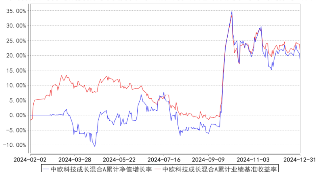
中欧科技成长混合A累计净值增长率与同期业绩比较基准收益率的历史走势对比图

注：本基金基金合同生效日期为 2024 年 2 月 2 日，自基金合同生效日起到本报告期末不满一年，按基金合同的规定，本基金自基金合同生效起六个月为建仓期，建仓期结束时各项资产配置比例已经符合基金合同约定。