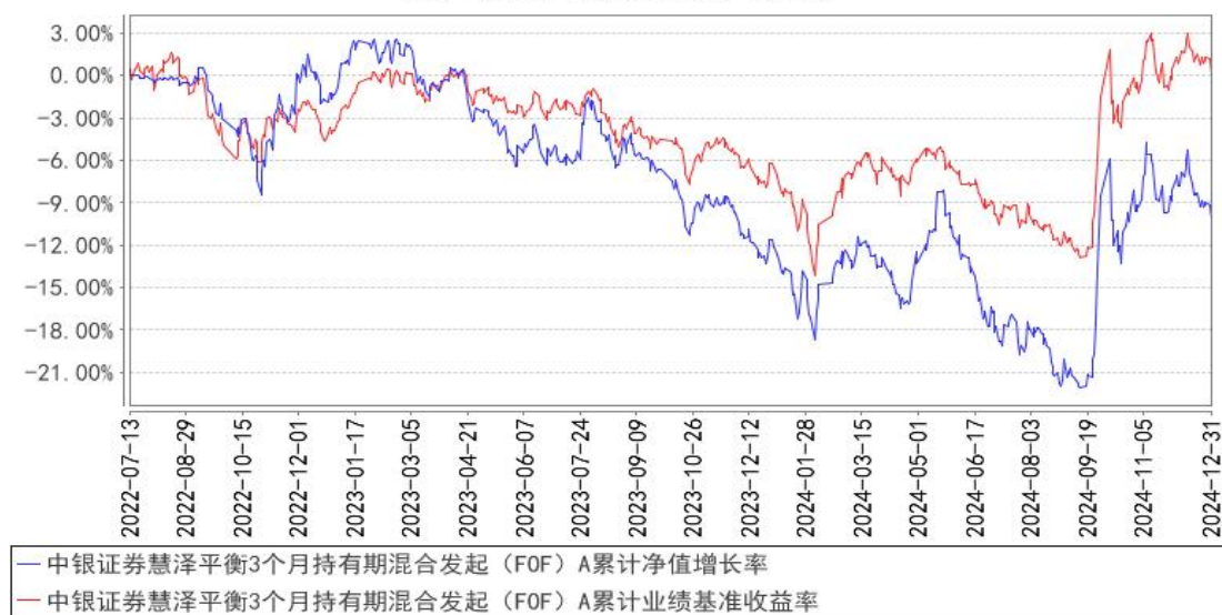
中银证券慧泽平衡3个月持有期混合发起 (FOF) A 累计净值增长率与同期业绩比较基准收益率的历史走势对比图