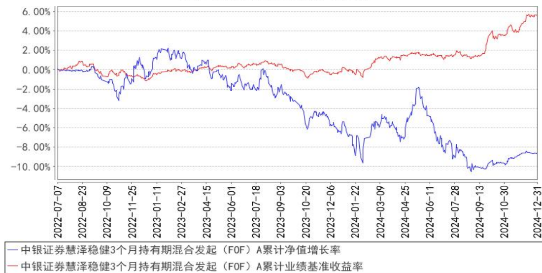
中银证券慧泽稳健3个月持有期混合发起（FOF）A累计净值增长率与同期业绩比较基准收益率的历史走势对比图