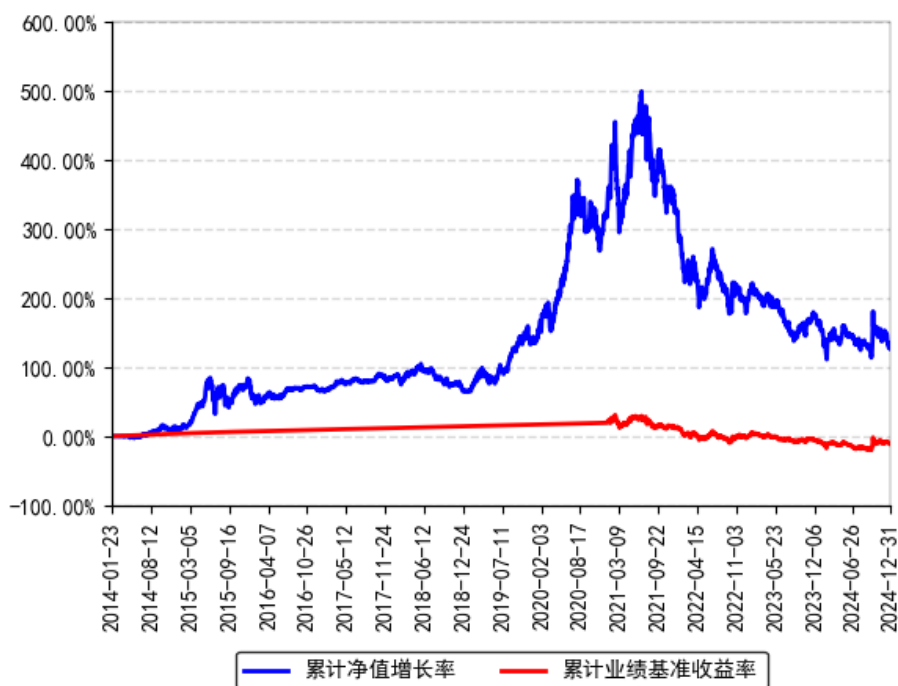
南方医药保健灵活配置混合A累计净值增长率与同期业绩比较基准收益率的历史走势对比图