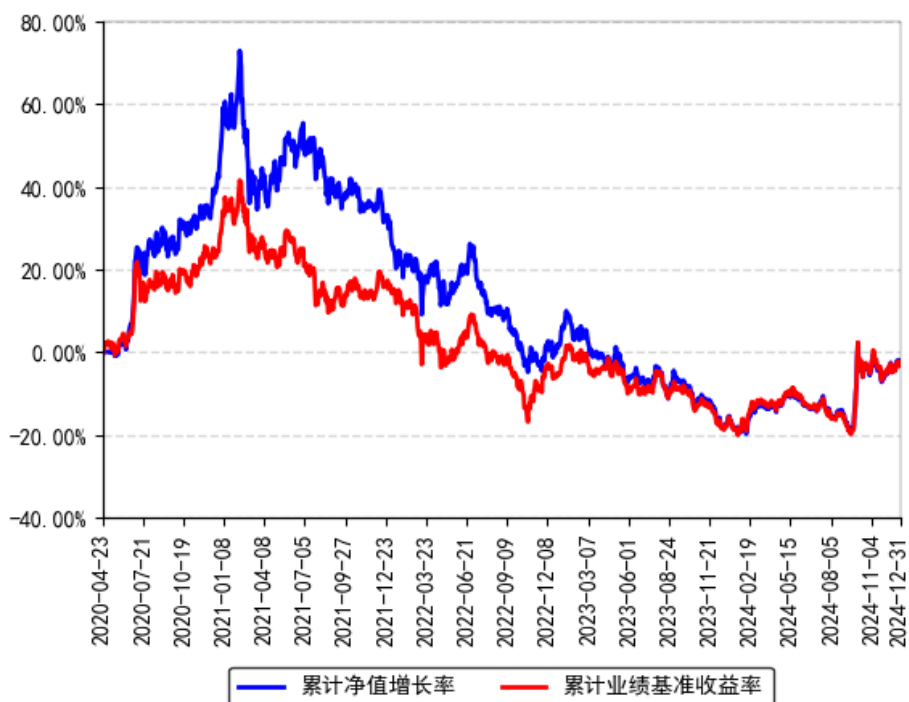
南方上证50指数增强发起A累计净值增长率与同期业绩比较基准收益率的历史走势对比图