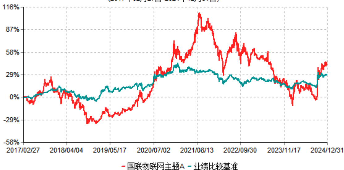
国联物联网主题A累计净值增长率与业绩比较基准收益率历史走势对比图 (2017年02月27日-2024年12月31日)