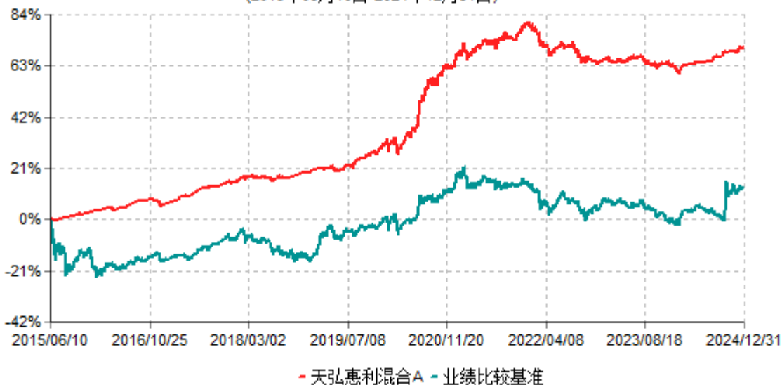
天弘惠利混合A累计净值增长率与业绩比较基准收益率历史走势对比图 (2015年06月10日-2024年12月31日)