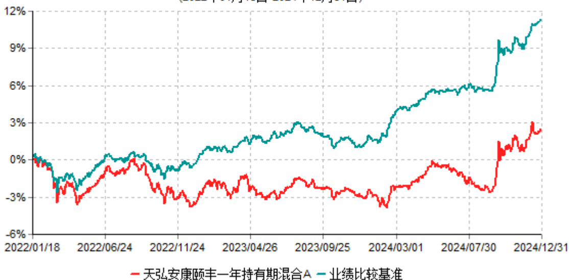
天弘安康颐丰一年持有期混合A累计净值增长率与业绩比较基准收益率历史走势对比图 (2022年01月18日-2024年12月31日)