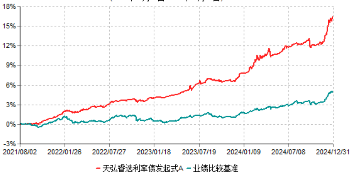
天弘睿选利率债发起式A累计净值增长率与业绩比较基准收益率历史走势对比图 (2021年08月02日-2024年12月31日)