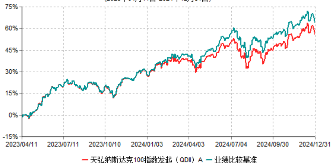
天弘纳斯达克100指数发起（QDII）A累计净值增长率与业绩比较基准收益率历史走势对比图 (2023年04月11日-2024年12月31日)