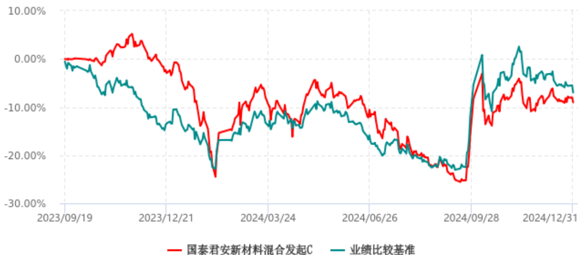
国泰君安新材料混合发起C累计净值增长率与业绩比较基准收益率历史走势对比图 (2023年09月19日-2024年12月31日)

注：按基金合同和招募说明书的约定，本基金的建仓期为六个月，建仓期结束时各项资产配置比例符合基金合同的有关约定。