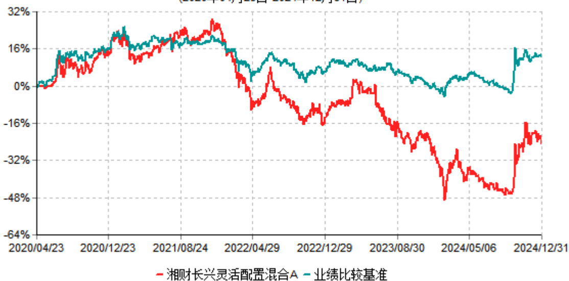
湘财长兴灵活配置混合A累计净值增长率与业绩比较基准收益率历史走势对比图 (2020年04月23日-2024年12月31日)