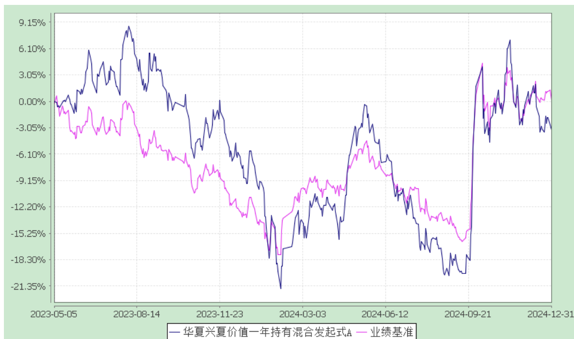
华夏兴夏价值一年持有混合发起式 C: