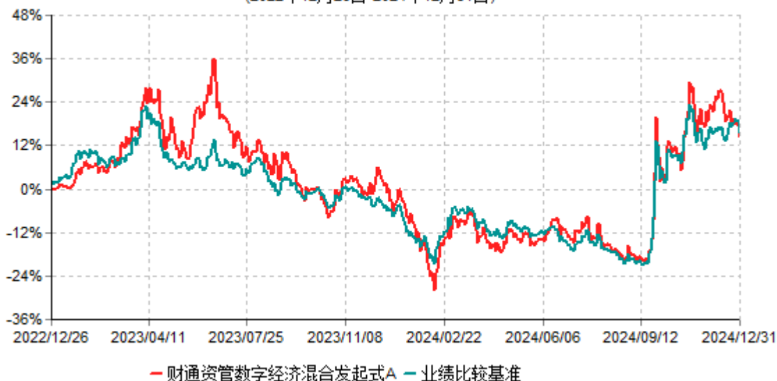
财通资管数字经济混合发起式A累计净值增长率与业绩比较基准收益率历史走势对比图 (2022年12月26日-2024年12月31日)