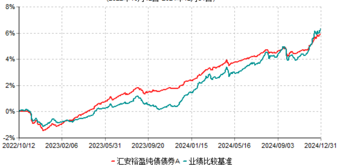
汇安裕盈纯债债券A累计净值增长率与业绩比较基准收益率历史走势对比图 (2022年10月12日-2024年12月31日)